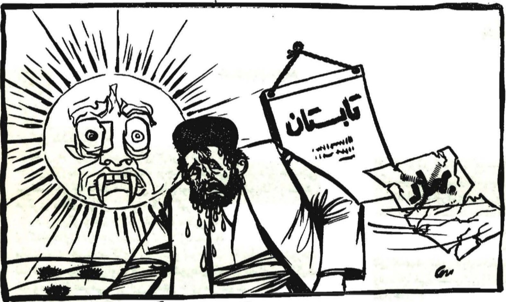
تابستان خشک، داغ، داغ، داغ...

نامه سرگشاده دانشگاهیان به رئیس جمهور بسم الله الحکیم العلیم ادع الی سبیل ربک بالحکمه والموعظه الحسنه و جادلهم بالتی هی احسن «قرآن کریم» در صفحه ۶