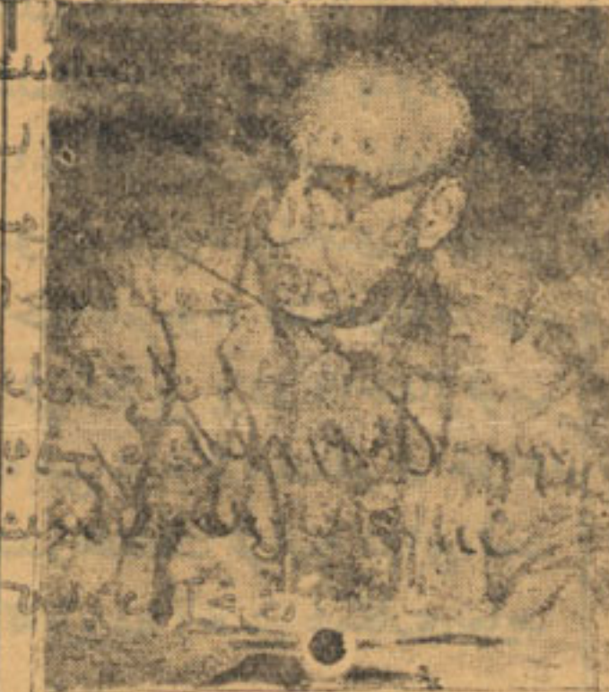
درد بصدق قهرمان نخست وزیر زنجیر شده میهن ما!

منظورهای بست انگشمارگران آجیبی کوشش مینمایند تا شاید در آزاده ولستان بزرگ ما خللی وارد آورند و این موضوع وقتی کاملاً مسلم میشود که در روزنامه دولتی کیهان (از قول مقامات متعلقه) های ذینفع! در تائید مطالب بالا که هر کدام نمودار بارزی از خیانت مسلم زاهدی است مینویسند: «ما اکنون در راه رسیدن حل مسئله نفت خوشبینی بی سابقه ای در محافل خارجی تهران موجود است! در حالیکه این سؤال پیش میآید که تا چه اندازه میتوان (بسیار که!) از کجا و چه میتواند باشد؟ جز اینکه با مذاکرات مخفیانه و دسیسه های دانا کارنامه ای که بدولت اخیان زاهدی کمک مجلس فرمایشی با اربابان خود مینماید قصد دارند با بزرگداشت غرامت