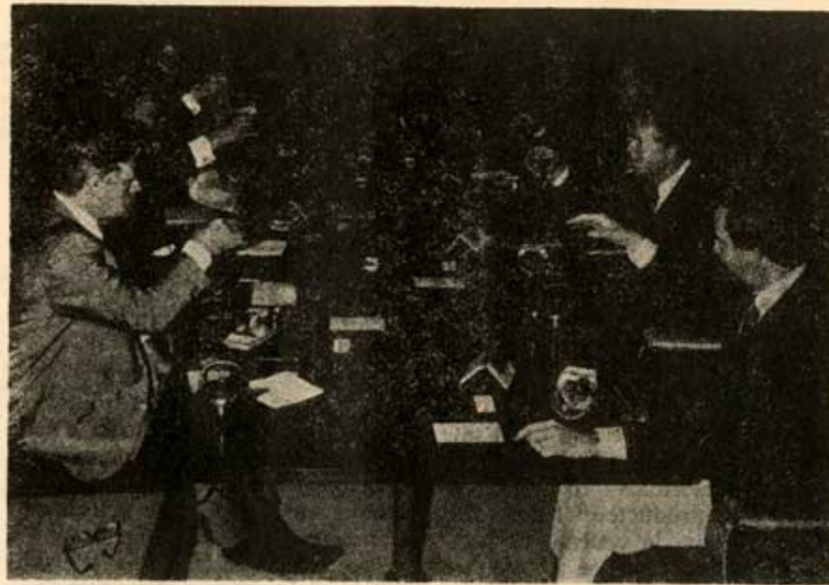
رهبران هفت کشور غرب بر سر سفره «صبحانه» ژان: «تصمیمات تاریخی»

توسط اوپک (۱۴۳۵ دلار هر بشکه). قیمت نفت این بازار از حد افسانه‌ای بشکه‌ای ۲۰ دلار، یعنی قیمتی که از طرف کارشناسان برای سال ۱۹۸۵ پیش‌بینی شده بود، نیز گذشت. اما اقدام محافظه کارانه عربستان سعودی مانع از آن خواهد شد که قیمت نفت از مرز ۲۳٫۵ دلار عبور کند. عربستان سعودی، و در دنبال این کشور امارات عربی متحد و قطر نفت خود را به قیمت ۱۸ دلار هر بشکه خواهند فروخت. درخواست مشتریان کشورهای دیگر اوپک باید نفت را بین ۲۱ تا ۲۲٫۵ دلار خرید. وزیران نفت کشورهای عضو اوپک، با توجه به لزوم حفظ وحدت اوپک، ترجیح به موضع عربستان سعودی نزدیک شده است. و بالاخره الجزایر نیز کمی از موضع سرسختانه خود عدول کرده است. کشورهای تولیدکننده نفت به خاطر حفظ وجهه خود در میان کشورهای جهان سوم، و هم چنین زیر فشار اعضاء آمریکایی لاتینی اوپک، قبل از تعیین قیمت‌های تازه نفت نسبت به سرنوشت کشورهای در حال توسعه ابراز نگرانی کردند. بدین ترتیب اولین اقدام این کشورها آزاد کردن ۸۰ میلیون دلاری بود که در صندوق ویژه سازمان اوپک مسدود شده بود. این مبلغ به گاهی بار اقتصادی کشورهای فقیر